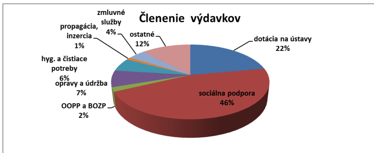
Obr. 3. Členenie výdavkov fakulty

Z uvedeného vyplýva, že najviac finančných prostriedkov z celkovej dotácie na tovary a služby bolo použitých na sociálnu podporu zamestnancov, t.j. príspevok na stravovanie, tvorbu sociálneho fondu, odstupné, odchodné a nemocenské dávky 46 % ( 116 200 €), dotácia na ústavy bola vo výške 22 % ( 55 930 €), výdavky na OOPP, BOZP a preventívne prehliadky 2 % (4 732 €), na opravy údržbu zariadení a budov 7 % (18 182 €), na hygienické a čistiace potreby 6 % (14 428 €), na propagáciu, reklamu a inzerciu 1 % (2 829 €), na zmluvné služby , revízie, likvidácia odpadu 4 % (10 534 €), na ostatný spotrebný materiál, elektroinštalačný, maliarsky , železiarsky materiál 12 % (30 496 €).